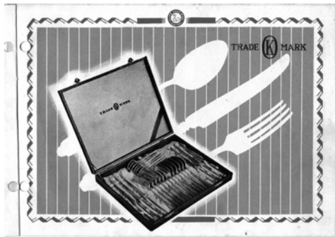
昭和25年のカタログ（小林工業株式会社）

本展では、燕の金属洋食器製造の歴史を振り返りながら、洋食器のデザインの変遷をたどります。