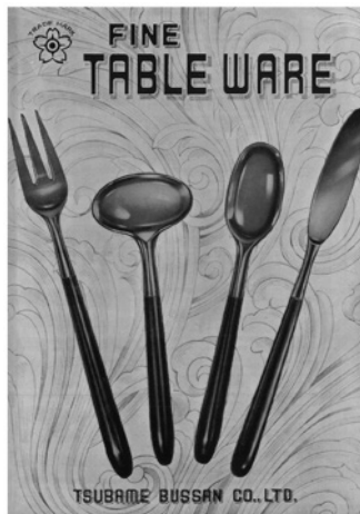
昭和40年代のカタログ（燕物産株式会社）